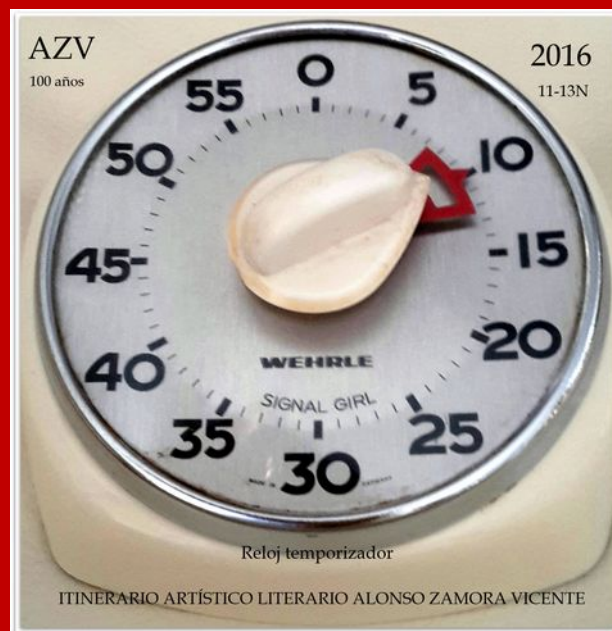
WEHLRE SIGNAL GIRL. Circa 1979